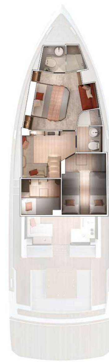
Galley-up Lower deck