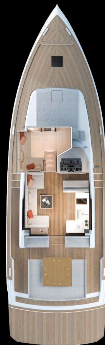
Galley-Up Main deck